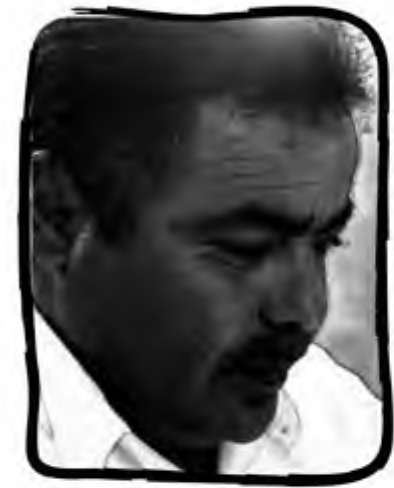
■ عبد الله الكبير

معركة الثورة الكبرى كانت في مصراتة ، لذلك كان الإحساس بها وبالتضحيات التي قدمت من أجل انتصارها أعلى بكثير من بقية المدن والمتاحق ، وإذا أظهرت المدينة حراكا قويا و متميزا ضد كل رموز النظام السابق فإن هذا لا يعني عدم تسامح أهلها وتجبرهم أو جهويتهم ، وإنما لأن الجراح مازالت تنزف ، ومازال الليل يطوي أنين جرحى ضنوا عليهم بسالعالج ، ومازالت دموع التكالى والأرامل واليتامى والمكالمين تهطل بفزارة.