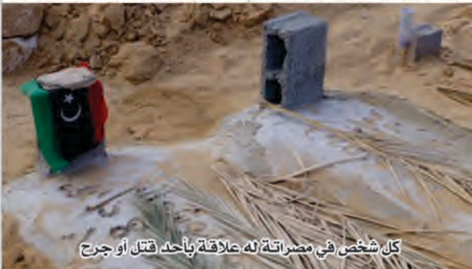
كل شخص في مصراتة له علاقة بأحد قتال أو جرح

العديد من الشباب مازالوا يجدون صعوبة للتعايش مع ما يعاينونه من مشاكل نفسية،