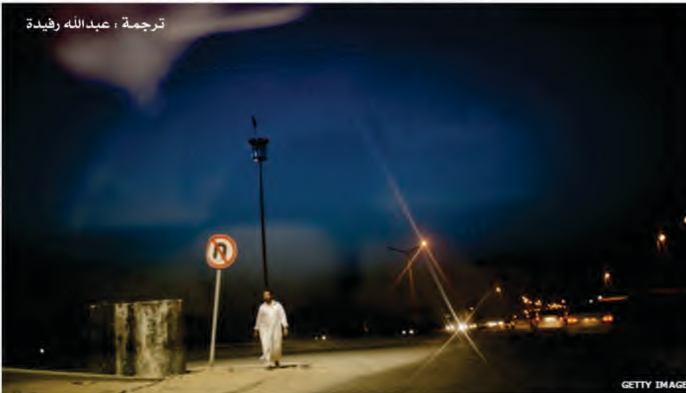
ترجمة : عبد الله رفيدة

مدينة مصراتة الليبية - والتي كانت مسرحاً لأكثر المعارك دموية خلال الثورة التي أنهت حكم العقيد القذافي في العام الفائت - تواجه أزمة رعاية نفسية حادة للمقاتلين السابقين الذين أصيبوا بأزمات نفسية نتيجة للحرب وما تلتها من إحباطات.