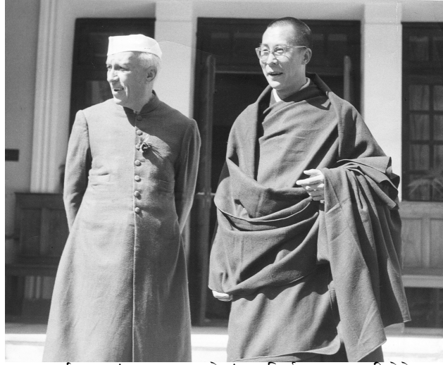
दलाई लामा पं. जवाहरलाल नेहरूंसह बिलां हाऊस, मसूरी येथे.

त्यावेळच्या पत्रकार परिषदेत मी औपचारिकरित्या सतरा-कलमी करार नाकारला. मी स्वतः पुढाकार घेऊन ही गोष्ट केली. पण मी जेव्हा मसुरीत होतो, तेव्हा माझ्या आयुष्यात पहिल्यांदाच मला आंतरराष्ट्रीय कायदेतज्ज्ञांशी बोलायची संधी मिळाली आणि ही गोष्ट करणं योग्य आहे याला त्यांनी दुजोरा दिला.