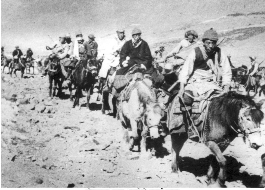
घोड्यावर स्वार असलेले दलाई लामा.

तिथं रस्ता असा नव्हताच. नदीच्या वरच्या बाजूनं टेकडीच्या कडेकडेनं जाणारी खडकाळ पायवाट होती. उजव्या हाताला चिनी छावणीतले दिवे आम्हाला दिसत होते. आम्ही ओळीनं चाललो होतो; आणि खालच्या बाजूला असलेल्या नदीच्या अंधार्या किनार्यावर त्यांची कुठे, कशी गस्त असेल सांगता येत नव्हतं. आम्ही बेटाजवळून गेलो. तिथं खाणीतून दगड नेण्यासाठी चिनी लोक ट्रकमधून सतत ये-जा करायचे - हे काम अगदी रात्रीसुद्धा चालायचं. त्यापैकी एक जरी ट्रक तेव्हा आला असता तरी त्याच्या दिव्यांमध्ये आम्ही पकडले गेले असतो. ज्यावरून आम्ही चाललो होतो तो रस्ता फारसा दिसत नव्हता. घोड्यांच्या नालांचा दगडावर आपटून होणारा आवाजही केवढा मोठा वाटत होता. गस्त घालणाऱ्यांना तो आवाज ऐकू जाईल अशी धास्ती वाटत होती, पण काही झालं तरी आम्हांला झपझप जाणं गरजेचं होतं. मी एकदा रस्ता चुकलो. माझं तट्टू पुन्हा वळवून मला मागे जावं लागलं. नंतर आम्हांला आमच्या मागच्या बाजूला विजेऱ्यांची लुकलुक दिसली. क्षणभर वाटलं, की चिनी आमच्या मागावर आले; पण ते तिबेटी सैनिक होते. आमच्या गटातले काहीजण भलत्या मार्गाने गेले तर काही चुकले होते, त्यांना ते मार्गदर्शन करत होते.