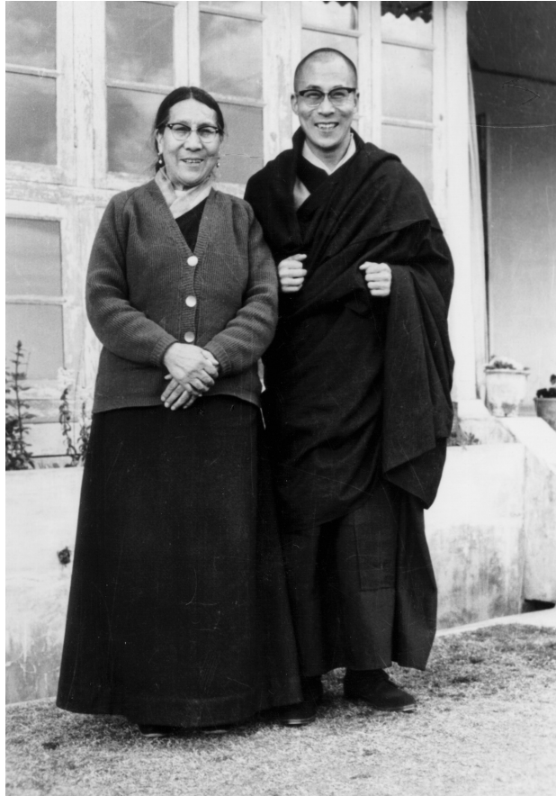
दलाई लामा त्यांच्या आईसह.

तिसरं म्हणजे, विश्वावर नाही पण आशियावर वर्चस्व गाजवायची चीनची इच्छा आहे. तसं उघडपणे बोललंही जातं आणि त्या प्रक्रियेतील पहिली पायरी म्हणजे तिबेटवर मिळवलेला विजय. मी काही लष्करी तज्ज्ञ नाही, पण कुणाच्याही सर्वसामान्य बुद्धीला लक्षात येईल, की डावपेचांच्या दृष्टीनं आशियातील इतर कुठल्याही देशाला तिबेटइतकं महत्त्व नाही. जवळ आधुनिक शस्त्र असतील तर इथले डोंगर म्हणजे अभेद्य बालेकिल्ल्यासारखे आहेत. इथून भारत, म्यानमार, पाकिस्तान आणि आग्नेय दिशेची आशियाई राज्यं यांच्यावर हल्ला चढवता येऊ शकतो. त्यांच्यावर वर्चस्व मिळवण्यासाठी, जसा आमचा धर्म नष्ट केला जात आहे त्या पद्धतीनं त्यांना धर्म नष्ट करता येईल आणि निरिश्वरवादी तत्त्वांचा आणखी प्रसार करता येईल. चिन्यांनी तिबेटमध्ये अठरा विमानतळ बांधले आहेत आणि देशभर लष्करी रस्त्यांचं जाळं पसरलेलं आहे. कारण त्यांना पक्कं ठाऊक आहे, की त्यांच्यावर हल्ला करायचा भारताचा इरादा नाही, त्यामुळं या लष्करी तयारीचा उपयोग पुढच्या काळातील साम्राज्य विस्ताराचा पाया म्हणून त्यांना होऊ शकतो.