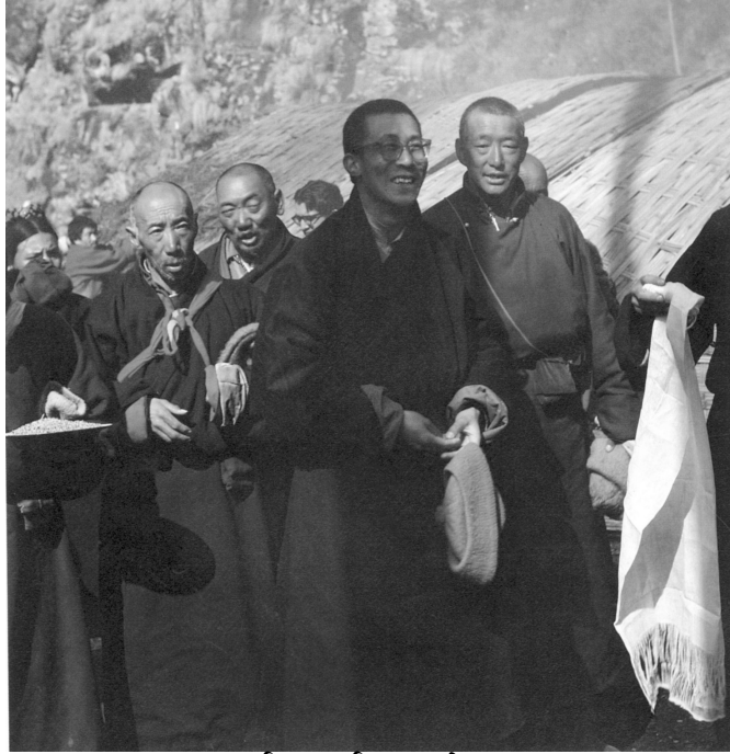
भारतीय सरहद्दीवर दलाई लामा.

पायथ्याजवळून गेला, पण नंतर तो करपो-लाच्या दिशेनं वर जावू लागला. हवा सुंदर आणि स्वच्छ होती; पण आम्ही पूर्वी पाहिलं होता त्यापेक्षा कितीतरी जास्त बर्फ तिथं होतं. जोर्याच्या वार्यानं ते भुरभुरीत बर्फ उचललं जात होतं आणि आमच्या चेहर्यावर आपटत होतं. बर्फाच्या चमकीपासून संरक्षण व्हावं म्हणून आमच्यापैकी फार थोड्या जणांकडे गाँगल होते. बर्फामुळं येणारं आंधळेपण टाळण्यासाठी बाकीच्यांनी रंगीत कापडाची पट्टी डोळ्यांवर बांधली होती, किंवा बरेच तिबेटी डोक्याभोवती जी लांब केसांची वेणी गुंडाळतात, तीच वेणी डोळ्यांभोवती बांधली होती.