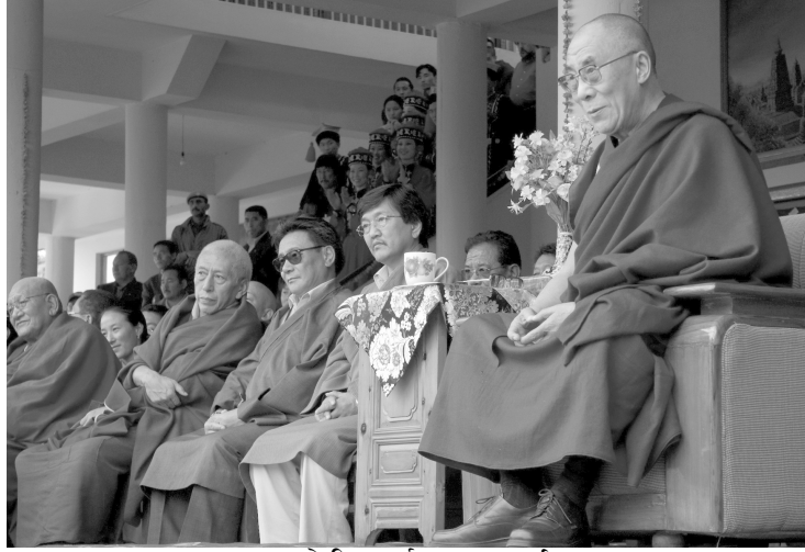
धर्मशाला येथील कार्यक्रमात दलाई लामा.

आश्चर्यकारक होता. आम्ही नक्की कुठं आहोत हे कळण्याआधीच 800 छोटी छोटी मुलं आमच्या ताब्यात काळजी घेण्यासाठी म्हणून दाखल केली गेली. माझ्या बहिणीला आणि तिच्या स्वयंसेवी मदतनिसांना या अवाढव्य कुटुंबासाठी किमान, तुटपुंज्या गरजा आयत्यावेळी जुळवाव्या लागल्या. या लहान मुलांना अजूनही आम्हांला किमान सुखसुविधाही देणं परवडत नाही, पण एक गोष्ट आम्ही निश्चित करू शकतो. या मुलांवर आमचं जिवापाड प्रेम आहे आणि निर्वासितांची मुलं जितपत आनंदी राहू शकतील तितकं आम्ही त्यांना निरोगी आणि आनंदी ठेवू शकण्यासाठी धडपडत आहोत. भारत सरकार त्यांच्यासाठी आम्हांला शिधा देत आहे आणि इतर लोक आणि स्वयंसेवी सहाय्य संघटना इतर अनेक मार्गांनी मदत करत आहेत. हळूहळू मोठ्या झालेल्या मुलांना आम्ही इतर ठिकाणच्या शाळांमध्ये पाठवून दिलेलं आहे आणि आता धर्मशाला इथं आमच्याकडे सात वर्षांच्या खालची तीनशे मुलं आहेत.