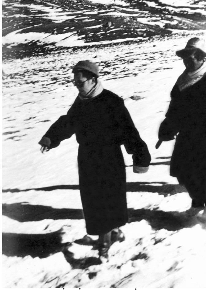
बर्फाळ पर्वत पार करताना दलाई लामा.

पाच दिवसांच्या या वाटचालीत आमच्या योजना आकार घेत होत्या. त्यानुसार आम्ही छेन-ये या ठिकाणी एक दिवस थांबायचं ठरवलं. त्यामुळं आम्हांला भविष्याबद्दल सविस्तर चर्चा करता आली असती. तसंच ल्हासातल्या अधिकार्यांना आणि इतर गनिमी सैनिकांना काही सूचना पाठवता आल्या असत्या. ल्हुडचे जोङ या जागेपर्यंत पोहोचेपर्यंत कूच करत राहवं असा आमचा विचार होता. सरहद्दीपासून ही जागा फार दूर नव्हती. त्या भागातला सर्वात मोठा किल्ला तिथं होता आणि तिथून उरलेल्या दक्षिण तिबेटबरोबर उत्तम संपर्कव्यवस्था होती. आम्ही असा विचार केला, की मी तिथं राहावं आणि चिन्यांबरोबर शांततापूर्ण वाटाघाटी पुन्हा चालू करता येतील का यासाठी प्रयत्न करावा. आम्हाला एवढी तरी आशा होती, की मी अजूनी तिबेटमध्येच राहिलेलो आहे, हे कळल्यावर तरी चिन्यांना वाटाघाटी-बोलाचाली करण्यात फायदा वाटेल आणि कदाचित अजूनही ल्हासावर बाँबचा हल्ला होणं थांबू शकेल.