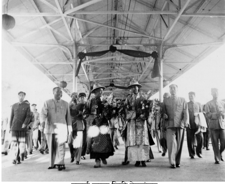
दलाई लामा चिनी नेत्यांसह

त्याच्याबरोबरची माझी पुढची मुलाखत जवळ जवळ तीन तास चालली; आणि तिथं दुभाष्याशिवाय दुसरं कोणीही उपस्थित नव्हतं. पुन्हा अर्थातच आम्ही बहुतांशी तिबेट आणि त्याच्या भविष्याबद्दल बोललो. मी तिबेटमध्ये नुकत्याच घडलेल्या घटनांची व्यक्तिशः त्याला माहिती दिली. आमच्या परिस्थितीबद्दल जर त्याच्या मनात काही शंका असतील तर त्या दूर करणं हा माझा प्रयत्न होता. त्याच्या मनात विश्वास निर्माण व्हावा अशी माझी इच्छा होती, कारण माझी खात्री होती, की आडमुठेपणानं केवळ विरोध करून चिनी अमलापासून आमची सुटका झाली नसती. त्याची तीव्रता फक्त आम्हीच कमी करू शकत होतो आणि काहीतरी सहन करण्याजोगी परिस्थिती यातून निर्माण व्हावी यासाठी सहनशीलपणे प्रयत्न करू शकत होतो.