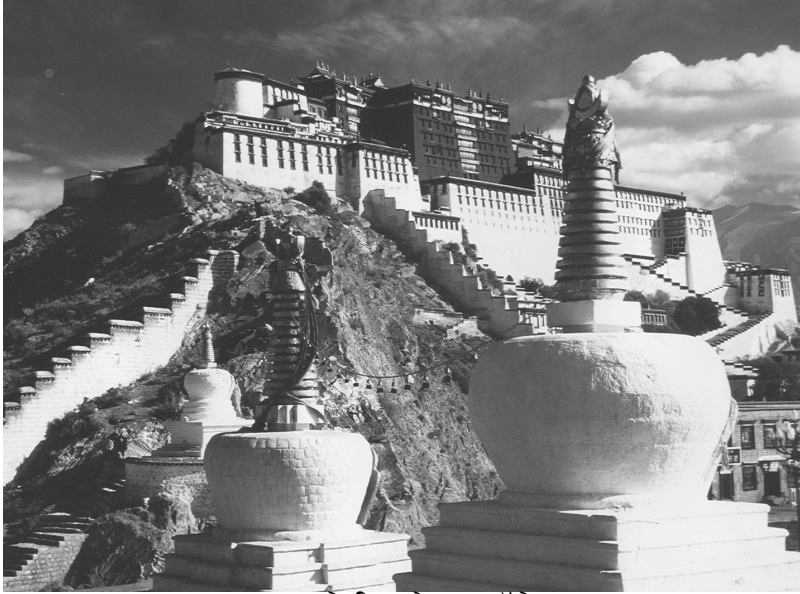
ल्हासा येथील पोताला पॅलेस

आमचा काफिला प्रचंड झाला होता. मोठ्या मिरवणुकीनं आम्ही पवित्र शहराकडं जाऊ लागलो. आमच्या रस्त्याच्या दुतर्फा हजारो भिक्षू रंगीत झेंडे, पताका घेऊन ओळीनं उभे होते. लोकांचे अनेक गट स्वागतपर गीत गात होते आणि वाद्यं वाजवत होते. तिबेटी लष्कराच्या सर्व पलटणींमधील सैनिक मला खडी सलामी देण्यासाठी थांबले होते. ल्हासामधील यच्चयावत सारी जनता, स्त्री-पुरुष, तरुण किंवा वृद्ध - सारेजण मला घ्यायला आणि स्वागत करायला, सजूनधजून दाटीवाटीनं जमले होते. मला जाताना पाहून 'आज आमच्या आनंदाचा दिवस उगवला आहे' किंवा 'सण सुरू झाला आहे' अशा त्यांच्या घोषणा मला ऐकू येत होत्या. मी स्वप्नातच आहे की काय असं मला तेव्हा वाटलं. मी एका विस्तीर्ण बागेत आहे, आसमंत देखण्या फुलांनी व्यापून गेला आहे, बागेत मंद, मृदू अशा वार्याच्या झुळका वाहत आहेत आणि अतिशय डोलदारपणे मोर माझ्यापुढे नाचत आहेत, असंही त्यावेळी वाटू लागलं होतं. त्यावेळी अविस्मरणीय असा रानफुलांचा गंध होता आणि हवेमध्ये मुक्ततेचं आणि स्वातंत्र्याचं गीत मिसळलेलं होतं. शहरात पोहोचेपर्यंत जणू मी या स्वप्नातून बाहेर पडूच शकलो नाही. मला मंदिरात नेण्यात आलं. तिथल्या पवित्र मूर्तींना मी नम्रपणे नमस्कार केला. नंतर सारी मिरवणूक नोर्बुलिङ्गाकडे गेली. ही जागा म्हणजे दलाई लामाचं उन्हाळ्यातलं घर होतं. मी अजूनही स्वप्नात रेंगाळत होतो; तेव्हाच माझ्या पूर्वाधिकाऱ्याच्या भव्य अशा दालनांची मला ओळख करून दिली गेली.