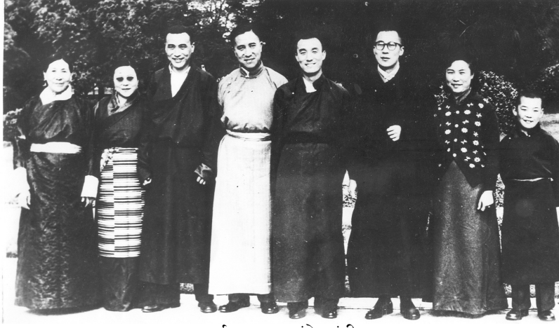
दलाई लामा व त्यांचे कुटुंबीय

देता येत नव्हतं. मंडळाचा वृत्तांत पूर्ण झाला तेव्हा नवीनच पुरावा समोर आला, ज्याच्यावरून मला खातरी पटली, की काही काही खेड्यांमधल्या सर्व स्त्री-पुरुषांचं चिन्यांनी निर्बीजीकरण केलेलं होतं.