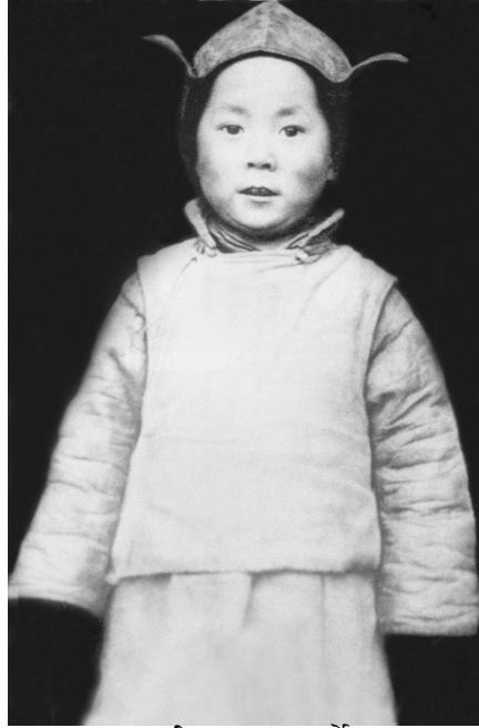
दलाई लामा वय वर्षे 4