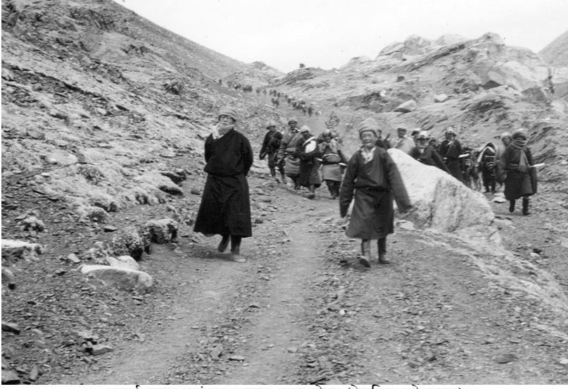
दलाई लामा त्यांच्या लहान भावाबरोबर (तेनजिन छोग्याल).

आमची त्यांच्याशी भेट झाली नाही. तुलनेनं त्या सुरक्षित आहेत हे कळल्यामुळं माझ्या मनावरचं मोठं ओझं कमी झालं. आमच्या बरोबर एक बॅटरीवर काम करणारा रेडिओ ग्राहक होता. त्यामुळं जेवढी शक्य होतील तेवढी सर्व बातमीपत्रं आम्ही ऐकत होतो. ल्हासाबद्दल काहीतरी बातमी कळेल अशी आशा होती. मला वाटतं, की छेन-ये मध्ये असताना पहिल्यांदा आम्ही ल्हासाचा उल्लेख ऐकला. ती बातमी 'व्हाईस ऑफ अमेरिका'नं दिली होती; पण त्यात फक्त शहरात अशांतता आहे आणि माझा ठावठिकाणा कळलेला नाही एवढंच म्हटलं गेलं.