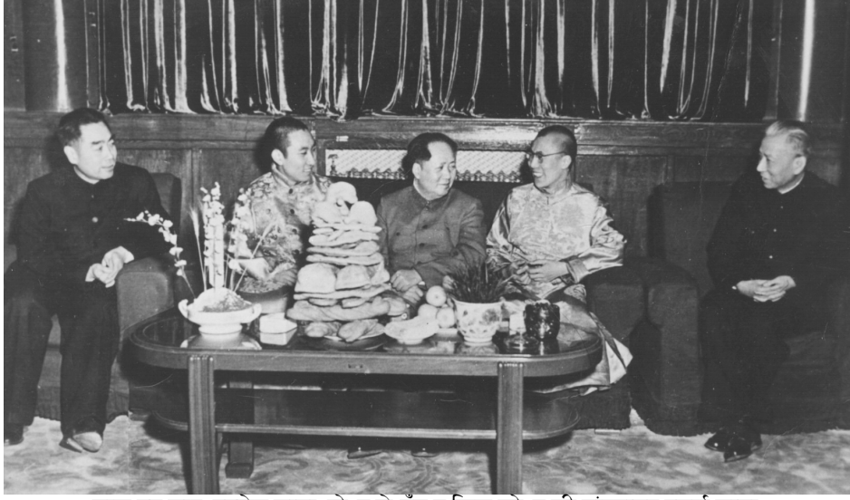
चाऊ एन लाइ, पनछेन लामा, मोआ झे-डुंग व लिऊ छोआ छी यांच्यासह दलाई लामा.

चीनच्या अधिकारी वर्तुळात पंतप्रधान चाऊ इन लाइ हा आणखी एक महत्त्वाचा माणूस होता. माझं त्याच्याबद्दल फारच निराळं मत झालं होतं. तो रेल्वे स्थानकावर माझं स्वागत करायला आला होता तेव्हा मी त्याला पहिल्यांदा भेटलो होतो आणि मग चीनमधल्या वास्तव्यात त्याच्याबरोबर माझं अनेकदा थोडं थोडं बोलणं झालं. त्यापैकी एका भेटीच्या वेळी त्यानं मला तिबेटच्या भविष्याबाबत बराच सल्ला दिला. राष्ट्रबांधणी आणि राष्ट्राचा विकास जितक्या लवकर शक्य आहे तितकं लवकर करणं फार महत्त्वाचं आहे, असं तो म्हणाला. मी त्याला सांगितलं, की आमचा देश मागास आहे हे आम्हाला ठाऊक आहे; तसंच आयुष्यातील लौकिक परिस्थितीची दशा सुधारणं आणि प्रशासनात आधुनिकता आणणं हे आता शक्य होईल. मी स्वतः या दिशेनं सुरुवात केली होतीच. जर साधनसंपत्तीचा विकास करायचा असेल तर आम्हाला निश्चितपणे आर्थिक मदतीची सर्वप्रथम गरज आहे, या मुद्याच्याही मी भर घातली.