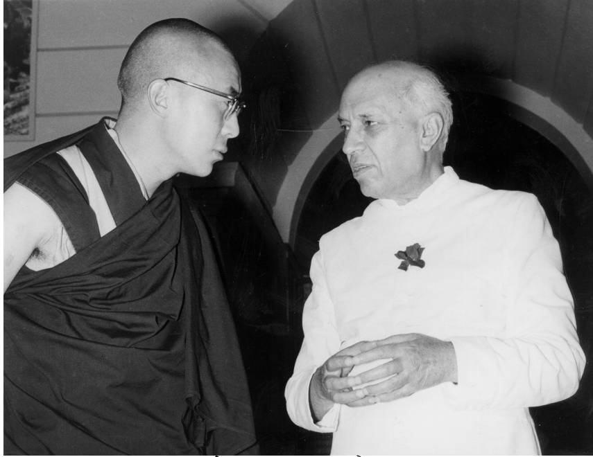
दलाई लामा पं. जवाहरलाल नेहरूंसह.

एकत्र याव्यात अशी आशा मी करतो आणि त्यामुळे आशिया आणि जगापुढं एक चांगलं उदाहरण राहील. नंतर त्यानं मला विचारलं, की तिबेटमध्ये सुधारणा घडवून आणण्यास माझी तयारी आहे का? त्यावर मी त्याला सांगितलं, की तिबेटमध्ये मी जेव्हापासून सत्तेवर आलो आहे तेव्हापासून राजकीय आणि सामाजिक आयुष्यात सुधारणा घडवून आणण्यासाठी मी परोपरीनं प्रयत्न करत आलो आहे. या प्रयत्नांना लवकरच यश यावं आणि नजीकच्या काळात त्याचे सुयोग्य परिणामही दिसावेत अशी मला अपेक्षा आहे; पण त्याचवेळी चिनी दुभाष्यानं खंड पाडला आणि मला तिथून दूर नेलं. चिनी दुभाष्या घाईघाईनं या संभाषणाची टिपणं घेतो आहे हे पाहून मला फार मजा वाटली. नंतर त्यानं मला सांगितलं, की मी जे काही बोलेल ते सर्व काही लिहून ठेवावं आणि अधिकार्यांना त्याचं वृत्त द्यावं असा त्याला आदेश दिला गेला होता.